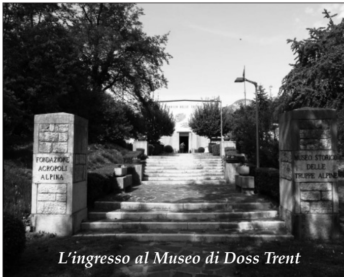
L'ingresso al Museo di Doss Trent

La conoscenza delle nostre origini, del nostro passato è legato indissolubilmente alla comprensione del nostro presente e di quello che potrebbe essere il nostro futuro di Alpini. Anche in questo il «Museo Nazionale Storico degli Alpini» può essere di valido aiuto: l'invito che i soci fondatori rivolgono con forza, in primis a tutti gli Alpini, ma anche a tutti i cittadini, è di